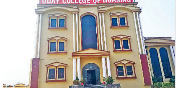
महेंद्रगढ़। उदय कॉलेज का भवन।