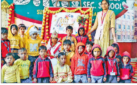
महेंद्रगढ़। कार्यक्रम में उपस्थित विद्यार्थी।