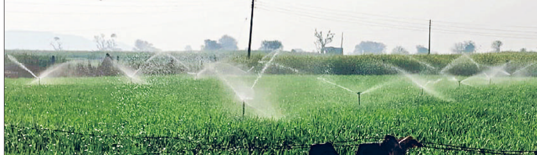
रेवाड़ी। एक खेत में फव्वारों से फसल की होती सिंचाई।

कोहरे से निजात मिलते ही दिन के तापमान में मामूली बढ़ोतरी दर्ज करने के लिए कठिन परिश्रम करने की सलाह दी। स्कूल के प्राचार्य