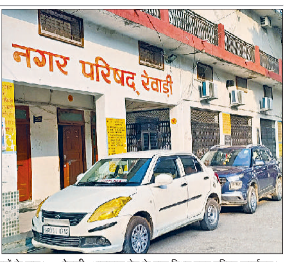
रेवाड़ी। इकमहरीसी बोर्ड पर अंकित अब तक के नगर परिषद प्रधानों के नाम। रेवाड़ी। भाड़ावास गेट के पास स्थित नगर परिषद कार्यालय।