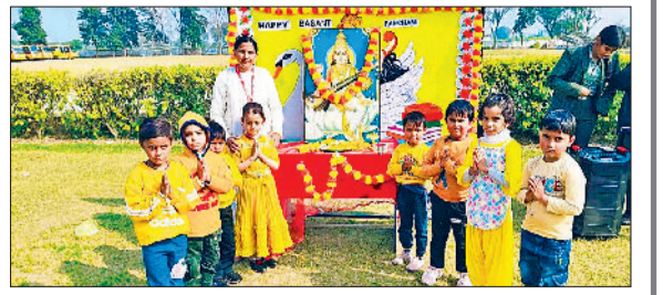
नारनौल। बसंत पंचमी पर्व में भाग लेते बच्चे।