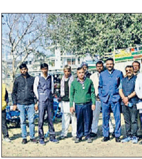
रेवाड़ी। कृषि यंत्रों का भौतिक सत्यापन करते कमेटी के सदस्य।