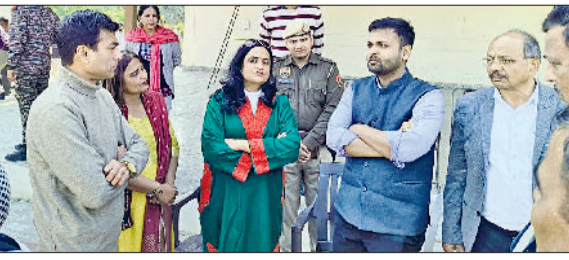
ओतप्रोत सहित प्रेरणादायक एवं शिक्षाप्रद होंगे। एडीसी ने बताया कि जिला मुख्यालय पर आयोजित होने वाले जिला स्तरीय गणतंत्र दिवस समारोह में हरियाणा के खेल, युवा अधिकारिता एवं उद्यमिता मंत्री