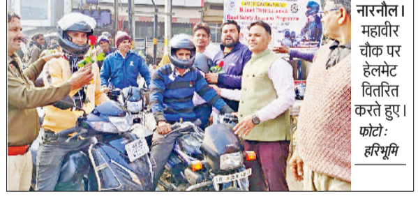
नारनौल। महावीर चौक पर हेलमेट वितरित करते हुए।