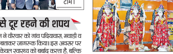
रेवाड़ी। पंचमुखी मंदिर में स्थापित राम दरबार तथा भंडारे का प्रसाद ग्रहण करते श्रद्धालु।