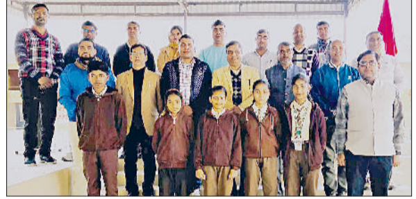
नारनौल। विद्यार्थियों को सम्मानित करता स्कूल स्टाफ।