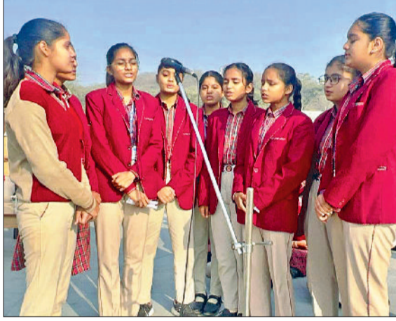
नारनौल। कार्यक्रम में गीत प्रस्तुत करती छात्राएं।