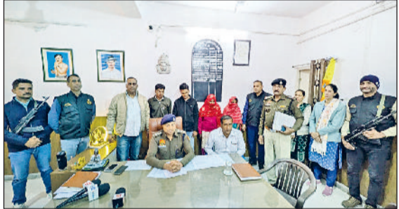
रेवाड़ी। पुलिस गिरफ्त में गुलेल गैंग के सदस्य, निमोठ में हुई चोरी का फैला सामान।