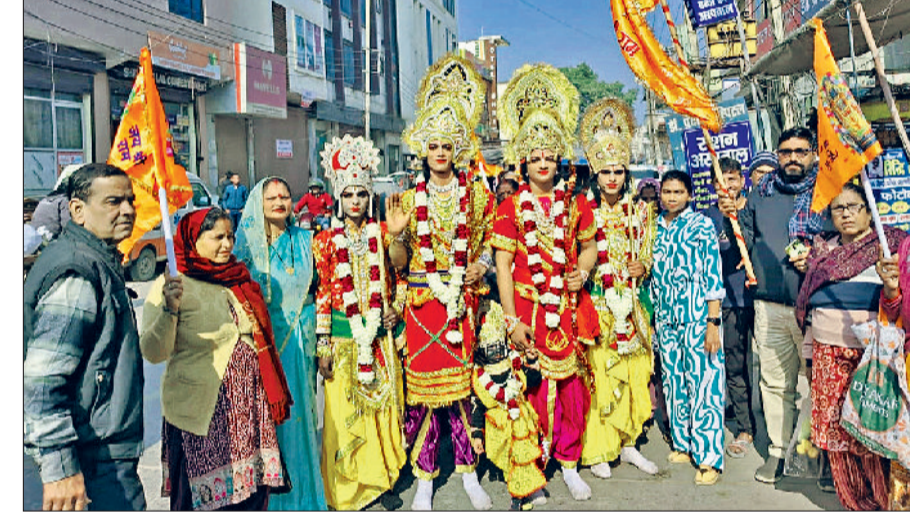
रेवाड़ी। शोभायात्रा में सती राम दरबार की झांकी व उपस्थित श्रद्धालु।